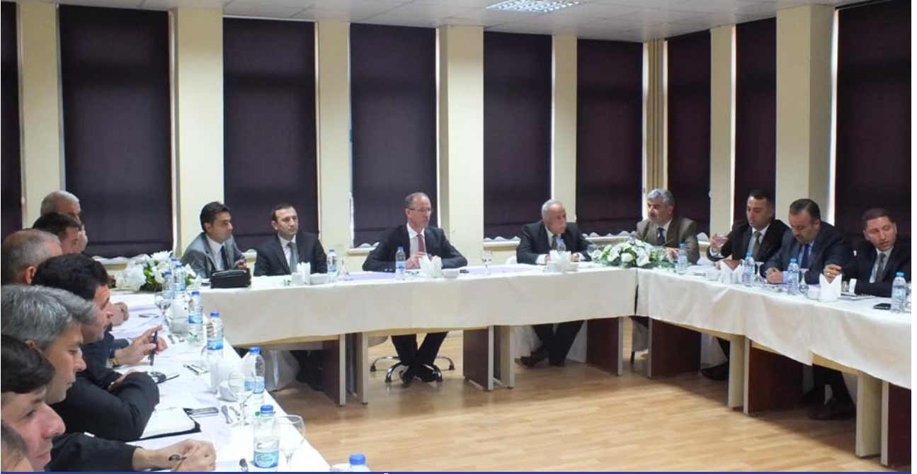
13 Kasım 2014 İl Değerlendirme Toplantısı Açılış Konuşması - İl Millî Eğitim Müdürümüz Saim Kuş

Y ozgat İl Millî Eğitim Müdürlüğü 2015-2019 Stratejik Plan Durum Analizi Raporu 06 Kasım 2014 tarihinde yayınlanmıştır. İlçe Millî Eğitim Müdürlükleri ve okullarımız ile paylaşılan Durum Analizi Raporu aynı zamanda kurumlarımız için bir yol haritası olmuştur.